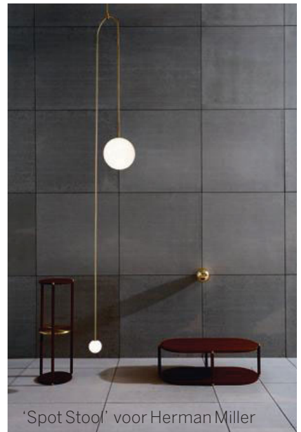
'Spot Stool' voor Herman Miller