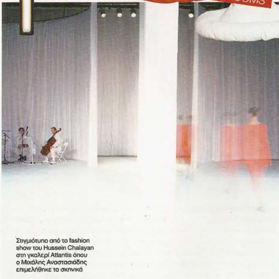
Στιγμιότυπο από το fashion show του Hussein Chalayan στη γκαλερί Atlantis όπου ο Μιχάλης Αναστασιάδης επιμελήθηκε τα σκηνικά