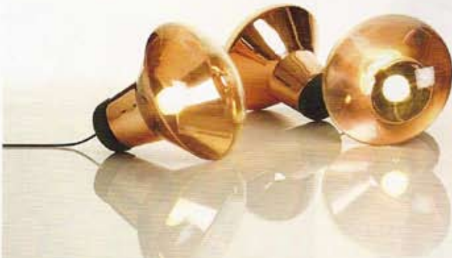
Blow light, Tom Dixon.