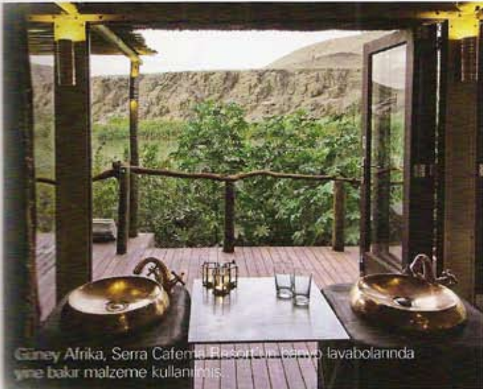
Güney Afrika, Serra Cafema Resort'un lavabo lavabolarında yine bakır malzeme kullanılmış.

Pirinç tonları o kadar sıcak ve cazibelerdir ki, insanları kendisine doğru çağırır ve büyülemeye başlar. Yüksek düzeyde parlatılmış metaller tam anlamıyla görsel bir şölen sunar. Mekânlarda o kadar baskındır ki, etkileyici bir vurgu için seyrekçe serpiştirilmeleri ya da tek bir bölümde yoğun kullanılmaları yeterlidir. Örneğin,