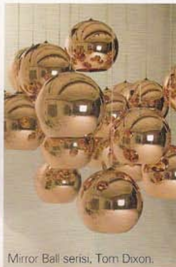
Mirror Ball serisi, Tom Dixon.