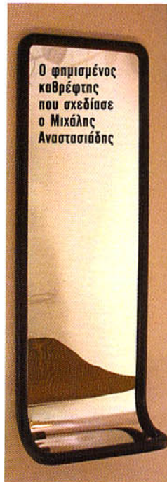
Ο φημισμένος καθρέφτης που σχεδίασε ο Μιχάλης Αναστασιάδης