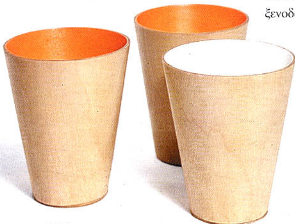
«Message cup», η γνωστή κούπα επικοινωνίας, σε λευκή και πορτοκαλί έκδοση